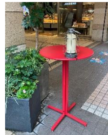
<元町通りテーブル過去開催の様子>