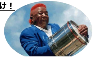
日本のサンバの父（ダミアン・ゴメス・デ・ソウザ）が明星学園サンバ部、サンパチームと一緒に GREENING 広場を盛り上げます。

本イベントでは“ 気持ちよく過ごせる音楽 ”をテーマに、 吉祥寺のライブハウスやミュージックバー、レコードショップ に 1 日ずつアーティストをディレクションしていただきました。アーティスト約 45 組がステージでの生演奏で会場を盛り上げ、屋外で飲むビールを一層美味しくします。また、吉祥寺にほど近い学校の部活動やサークルで音楽活動をしている学生もラインナップ。開放的な屋外広場で、春空の下、気持ちの良い音楽を聴きながらクラフトビールをお楽しみください。