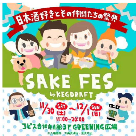
<イベントキービジュアル>

また、女性も楽しめるフルーツを使ったボタニカルな飲みやすい日本酒カクテルや、おいしいグルメ&デザートも！日本酒好きも日本酒初心者も飲めない人も、みんな楽しめる日本酒のイベント「酒フェス」です。