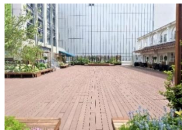
[A 館 3 階屋外スペース「GREENING 広場」]