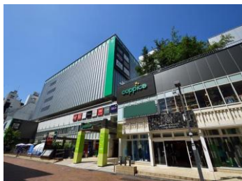
[コピス吉祥寺外観]