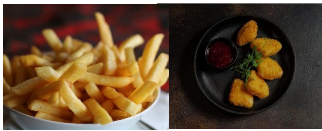
「フライドポテト」・「ナゲット」

丸干しホタルイカ、炙り鯖ジャーキー、鮭とばなど、日本酒との相性抜群のおつまみ。手に取りやすい小分けのパックでご提供。