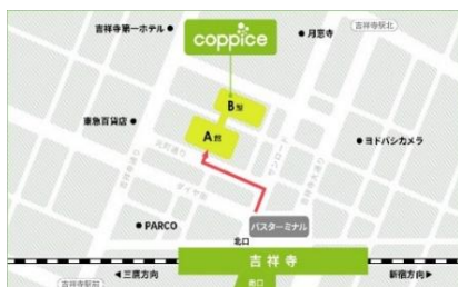
[コピス吉祥寺アクセス MAP]