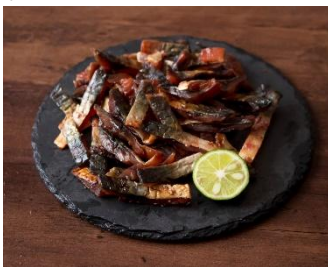
「炙り鯖ジャーキー」

A 館 3 階屋上スペース GREENING 広場では、日本酒の提供はもちろん。日本酒とあうおつまみや、おいしいグルメ、デザートもご用意します。