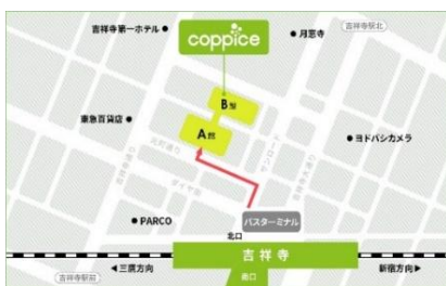
[コピス吉祥寺アクセス MAP]