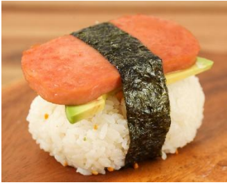
「 ポークおむすび 」

沖縄の食文化であるポークおむすび。ついつい何個もたべてしまう！そんな中毒性のあるおむすびを是非ご賞味下さい！