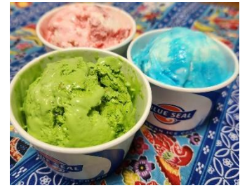
「 ブルーシールアイス 」

沖縄の郷土料理である「沖縄のそば」。もちもちした麺と豚骨やかつお節でとった濃厚な出汁を味わって。