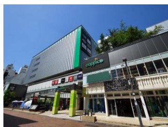
[コピス吉祥寺外観]