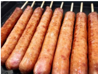
「 アグー豚フランクフルト 」

大定番のブルーシールアイス。沖縄ならではのフレーバーもご準備しております。暑い夏にぴったり！