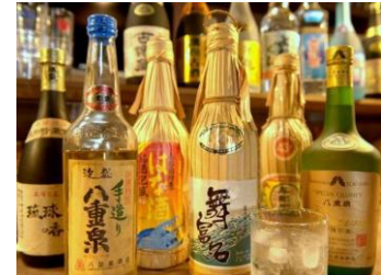
「 泡盛 」

沖縄県の伝統的な蒸留酒である「泡盛」。濃厚で芳醇な香りは、グルメとの相性も完璧◎