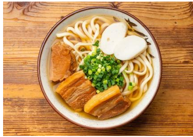
「 沖縄そば 」

沖縄の食文化であるポークおむすび。ついつい何個もたべてしまう！そんな中毒性のあるおむすびを是非ご賞味下さい！