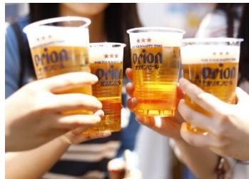
「 オリオンビール 」

沖縄のブランド豚「アグー豚」を使用したフランクフルト。肉汁あふれるジューシーな味わいです。お酒のおつまみにもどうぞ！