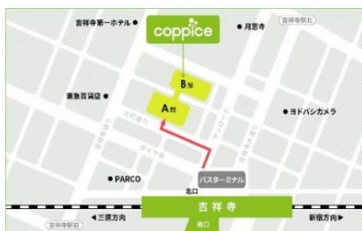
[コピス吉祥寺アクセス MAP]