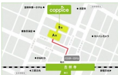
[コピス吉祥寺アクセス MAP]