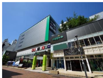
[コピス吉祥寺外観]