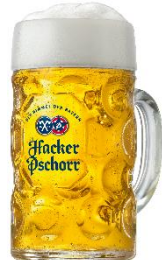
ハッカー・プショール

オクトーバーフェストといえばこのビール！爽やかな苦みとほのかな甘みが絶妙で、ごくごく飲めるビール。オクトーバーフェストの為に製造されるプレミアムなビールです。