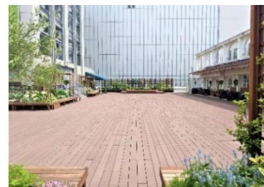
[A館3階屋外スペース「GREENING 広場」]