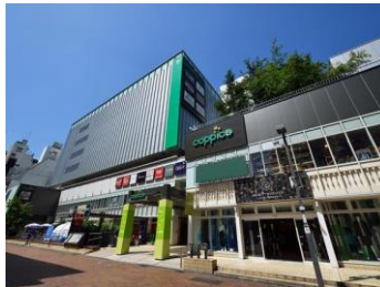
[コピス吉祥寺外観]